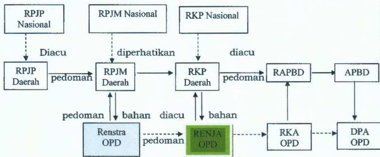
Gambar 1.1 Keterkaitan Antar Dokumen Perencanaan

Menurut Peraturan Menteri Dalam Negeri Nomor 86 Tahun 2017 tentang Tata Cara Perencanaan, Pengendalian Dan Evaluasi Pembangunan Daerah, Tata Cara Evaluasi Rancangan Peraturan Daerah tentang Rencana Pembangunan Jangka Panjang Daerah Dan Rencana Pembangunan Jangka Menengah Daerah, serta Tata Cara Perubahan Rencana Pembangunan Jangka Panjang Daerah, Rencana Pembangunan Jangka Menengah Daerah Dan Rencana Kerja Pemerintahan Daerah bahwa Rencana Kerja (Renja) Kecamatan Wonorejo Kabupaten Pasuruan adalah dokumen perencanaan Kecamatan Wonorejo untuk periode 1 (satu) tahun, yang memuat kebijakan, program dan kegiatan pembangunan baik yang dilaksanakan langsung oleh pemerintah daerah maupun yang ditempuh dengan mendorong partisipasi masyarakat. Dari uraian diatas dapat dijabarkan beberapa hal sebagai berikut :